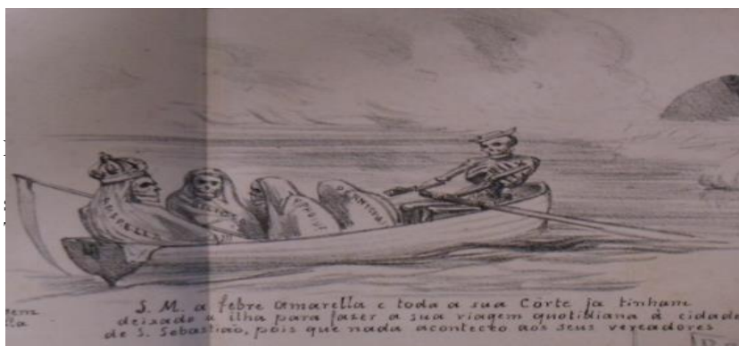
Figura 3. AGOSTINI, Angelo. Revista Ilustrada, 1881, nº 238, p. 4. "S. M. a febre amarela e toda a sua Corte já tinham deixado a ilha para fazer a sua viagem quotidiana à cidade de S. Sebastião, pois que nada aconteceu aos seus vereadores."

Na Fig. 3, além dos já citados esqueletos representativos da Febre Amarela, da Febre Perniciosa e da Febre Tifóide, aparece também, em uma canoa guiada por um esqueleto que serve como barqueiro que segue em direção à cidade de São Sebastião do Rio de Janeiro, a Febre Biliosa que causava pânico entre a população.