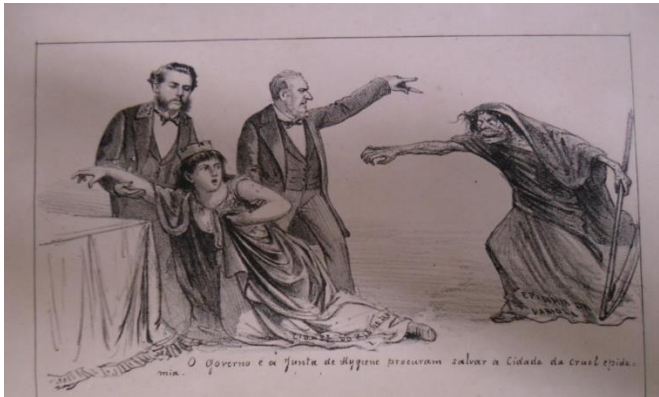
Figura 4. AGOSTINI, Angelo. Revista Ilustrada, 1878, nº 131, p. 5. “O Governo e a Junta de Higiene procuram salvar a cidade da cruel epidemia.”

Na Fig 4, uma mulher cheia de pústulas com uma foice aparece ameaçando a cidade do Rio de Janeiro representada por outra mulher bem vestida, branca e com uma coroa na cabeça que pede socorro aos pés dos representantes da Junta de Higiene. Um apelo lançado aos representantes da Junta responsável pelo combate às epidemias como último recurso de uma população aterrorizada pela Varíola. Cabe lembrar que em 1878 estávamos vivendo na forma de governo monárquica e a cidade do Rio de Janeiro era a capital do país, por isto na sua representação como figura feminina ela aparece coroada. É interessante ressaltar que, apesar da imensa população afrodescendente residente na cidade, ela aparece ainda como mulher branca. Os estigmas do racismo e do preconceito também derivado da escravidão se faziam presentes. Só quem tinha acesso ao letramento iria ler e entender as caricaturas, charges e textos publicados nos periódicos e isto levantava o velho sistema de exclusão social mais incidente sobre os(as) pretos(as) e pardos(as). Além da escravidão, a pobreza, a miséria e a falta de escolaridade que atingiam a grande massa da população brasileira naqueles tempos levavam à exclusão social.