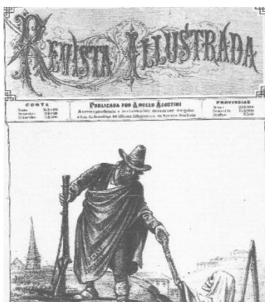
Figura 1. AGOSTINE, Angelo. Revista Ilustrada, 1881, p. 1 – “Venha, querida epidemia! Preparei-te a cidade o melhor possível para que possas ter uma esplêndida colheita de vidas”.

Hoje, a pandemia do Covid-19 ceifa milhares de vida no Brasil e no mundo, e a