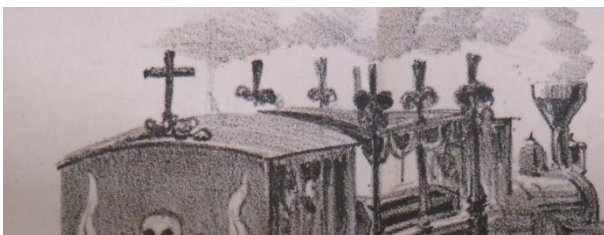
Figura 9. AGOSTINI, Angelo. Revista Ilustrada, 1878, nº 134, p. 4. "Os cadaveres serão conduzidos pela estrada de ferro do Rio do Ouro em carros mortuários. Ida e volta 10 leguas só."