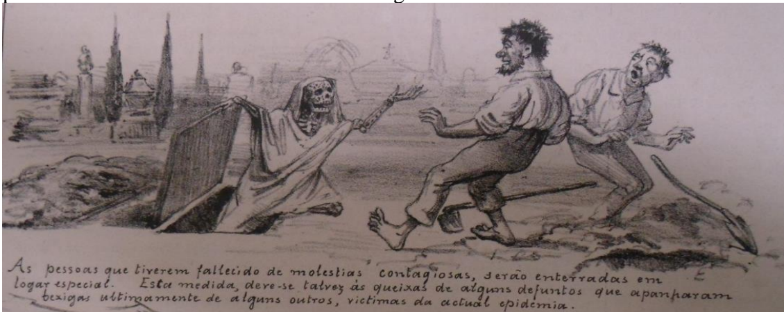
Figura 7. AGOSTINI, Angelo. Revista Ilustrada, 1878, p. 4. "As pessoas que tiverem fallecido de moléstias contagiosas, serão enterradas em logar especial. Esta medida, deve-se talvez às queixas de alguns defuntos que apanharam bexigas ultimamente de alguns outros, victimas da actual epidemia."

Manaus, no que se refere à quantidade elevada de corpos para serem enterrados nos cemitérios já lotados. Covas foram abertas em larga escala muito próximas umas às outras, enquanto filas de caminhões frigoríficos se formavam com os corpos das vítimas da pandemia esperando sepultamento. Na Fig. 7, vê-se a imagem de um esqueleto reclamando que contraiu bexigas com outros vizinhos enterrados ao seu lado, dada a proximidade das covas no cemitério na charge do século XIX.