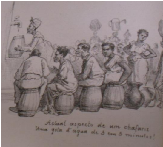
Figura 6. AGOSTINI, Angelo. Revista Ilustrada, 1878, nº 101, p. 4. "Actual aspecto de um chafariz. Uma gota d'agua de 5 em 5 minutos."

Por outro lado, a deficiência de ações afirmativas do governo federal para controlar a pandemia, seguindo os protocolos de saúde já estabelecidos pela área científica, nos leva a ver o caos se instalando mesmo na primeira onda da pandemia do coronavírus, como ocorreu em