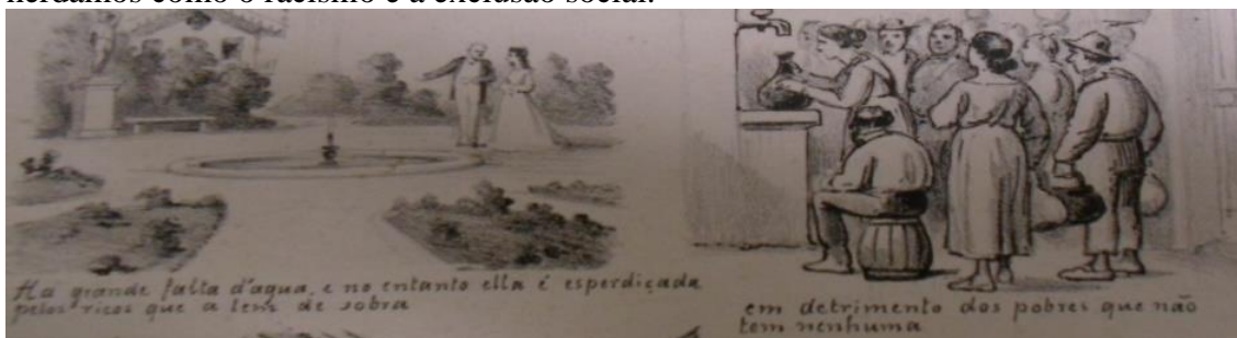
Figura 5. AGOSTINI, Angelo. Revista Ilustrada. 1878, nº 101, p. 4. "Ha grande falta d'agua, e no entanto ella é desperdiçada pelos ricos que a tem de sobra em detrimento dos pobres que não tem nenhuma."

É fato notório que a denúncia feita na charge de Ângelo Agostini no século XIX na Fig 5, na qual aparecem figuras representando os ricos com suas propriedades esbanjando água e outras representando os pobres, que dependiam dos chafarizes que não atendiam à demanda da população de baixa renda para se abastecerem (Fig. 6) aponta para um problema atual: como atender aos protocolos de higiene sem água, que se torna elemento primordial para evitar a propagação de vírus como o corona? A ausência de políticas públicas que garantam a equidade de direitos conduz às disparidades sociais que se agravam com o aumento demográfico e com o enraizamento dos estigmas que herdamos como o racismo e a exclusão social.