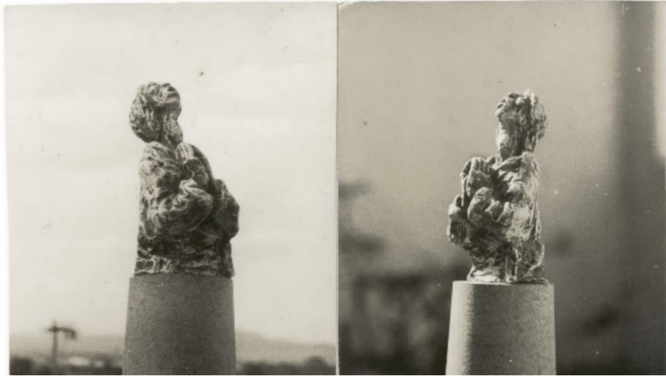
Figura 15 e 16, respectivamente: Konstantin Christoff, Mulher com mãos unidas, gesso, 15 cm. De alt, 1965, vista lateral direita e esquerda.