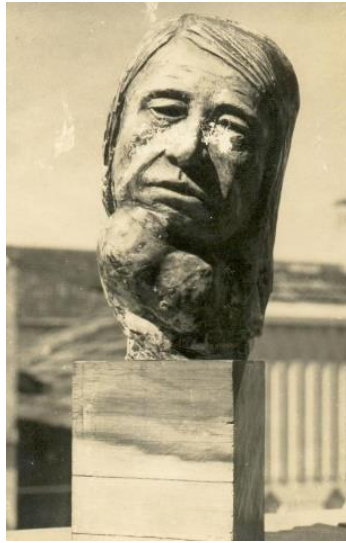
Figura 14: Konstantin Christoff, Cabeça de mulher com cabelos lisos e papo, gesso, 20 cm. alt, 1965.