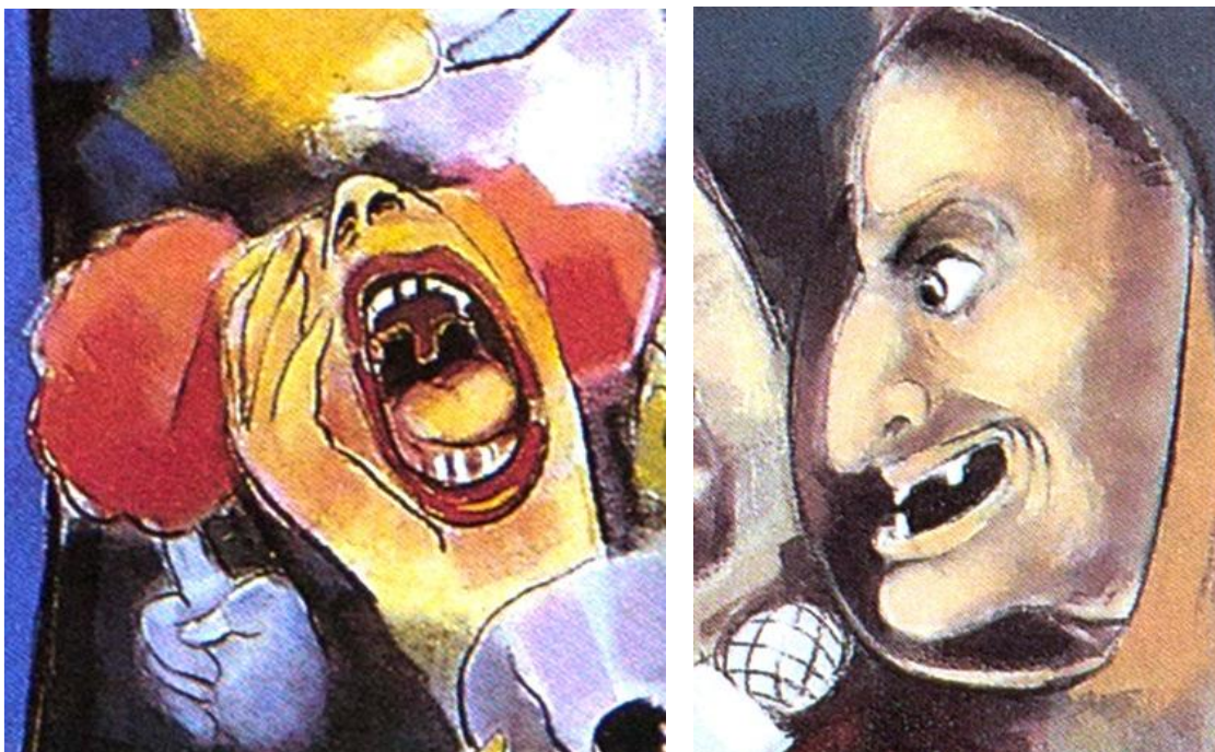
Figuras 02 e 03, respectivamente: Detalhe da pintura “O julgamento” (Homenagem a Dürer), a.s.t/m, 1989. Detalhe da pintura “Jesus Carrega a Cruz – Homenagem a Bosch e Aleijadinho”, a.s.t./m, 200 x 200 cm, 1989.

Figuras e seres monstruosos são apresentados nas obras pictóricas e escultóricas de Konstantin Christoff, como na série pictórica “Via Sacra”. São detalhes, nos quais estão visíveis os seres deformados que compõem as obras desse artista, numa clara referência à ironia e à provocação aos princípios do esteticamente preciso, como “espelho de um espírito fraco e sublimador de suas frustrações libidinais” (SODRÉ e PAIVA, 2002, p.09), conforme podemos verificar nas Figuras 02 e 03.