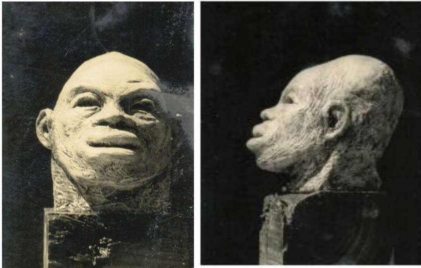
Figuras 10 e 11: Konstantin Chistoff, Homem de lábios grossos, gesso, 40 cm alt, 1965- vista de frente e vista lateral, respectivamente.

deformados - tanto feminino quanto masculino - podem ter suas marcas e distorções facilmente percebidas. São os sinais visíveis que se transportam da imagem fotográfica para o material moldado. Diferentemente da imagem fotográfica, agora são palpáveis, proporcionam diversos ângulos de visão e revelam toda a percepção sensorial do corpo enfermo. Daí surgem os detalhes dos efeitos da doença sobre o corpo: as rugas, as fissuras, as assimetrias que marcam a face, assim como, as protuberâncias que atingem e envolvem a região larga ou alongada do pescoço ou do crânio (Figuras 10 e 11).