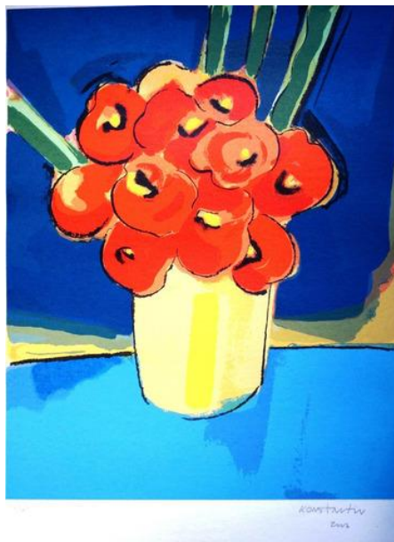
Figura 01 – Konstantin Christoff, Vaso De Flores, gravura, 2006.

Na Figura 1, por exemplo, pode-se observar que trata-se de uma pintura alegre, colorida, sem a inquietação e ironia comuns em suas telas de caráter crítico e político. Não existe nenhuma similitude com a irreverência e com o humor ácido, apresentado na sua Via Sacra. Nesta roupagem, sua pintura se torna comercial, decorativa. Intencionalmente, Konstantin Christoff abandona a crítica e a petulância com que produzia suas pinturas destinadas às galerias.