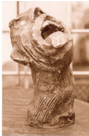
Figura 09: Konstantin Chistoff, Gárgula, Bronze, 30 cm de alt, 2002.

sentimentos em meio às distorções, gestos incompreensíveis e em posturas estranhas que acusam a anormalidade dos sujeitos. Como exemplo citamos a Figura 09 e as incontáveis personagens de seus quadros que igualmente possuem esse mesmo gesto – de mostrar a língua. Konstantin Christoff comenta “[...] é uma coisa boa mostrar a língua. Deve ser até importante mesmo, os médicos vivem pedindo” (GALERIA BANERJ, 1984, p. 4).