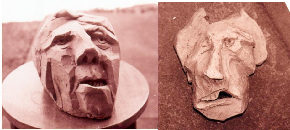
Figuras 12 e 13: Konstantin Christoff, Rosto deformado e enrugado, argila, 25 cm de alt, 2002 e Figura humana: dentes tortos, argila, 25 cm. alt, 2002, respectivamente.