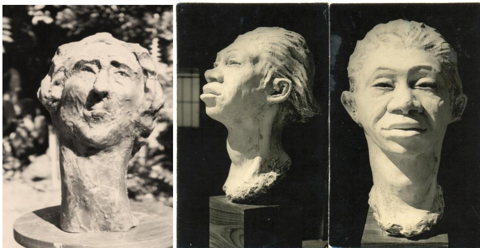
Figuras 04 ,05 e 06, respectivamente: Konstantin Christoff, Rosto alongado de mulher de cabelos curtos, molde em cera, 40 cm de alt, 2002 e Rosto de mulher, gesso, 30 cm de alt., 1965 de perfil e de frente.

Além disso, as aproximações das esculturas que produziu com a fotografia se fazem presentes na representação da doença. Isso principalmente quando dá ênfase às protuberâncias no pescoço alongado feminino, quase sempre, alterado pelo bócio. Apesar de que, pode ser sutilmente perceptível essa alteração (Figuras 04, 05 e 06).