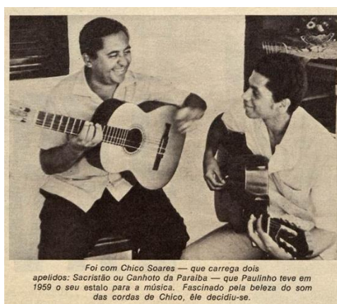
Figura 1 - Paulinho da Viola e Canhoto da Paraíba. Foto sem crédito. (PINHEIRO, 1970)

Se para Paulinho da Viola o encontro foi crucial a ponto de lhe conduzir à carreira de músico, para Canhoto da Paraíba, a nascente amizade representou futuras parcerias que o tornaram conhecido em âmbito nacional, como a gravação de discos com produção e participação do compositor carioca e o convite para participar de edições do Projeto Pixinguinha juntamente com o amigo e parceiro (fig. 1). A viagem ao Rio também o fez conhecido entre os chorões do sudeste, de modo que ainda nos anos 1970 os choros Tua imagem e Visitando o Recife foram gravados por Toquinho (no LP Boca da noite , de 1974) e pelo conjunto Época de Ouro (no LP Clube do choro , de 1976), respectivamente.