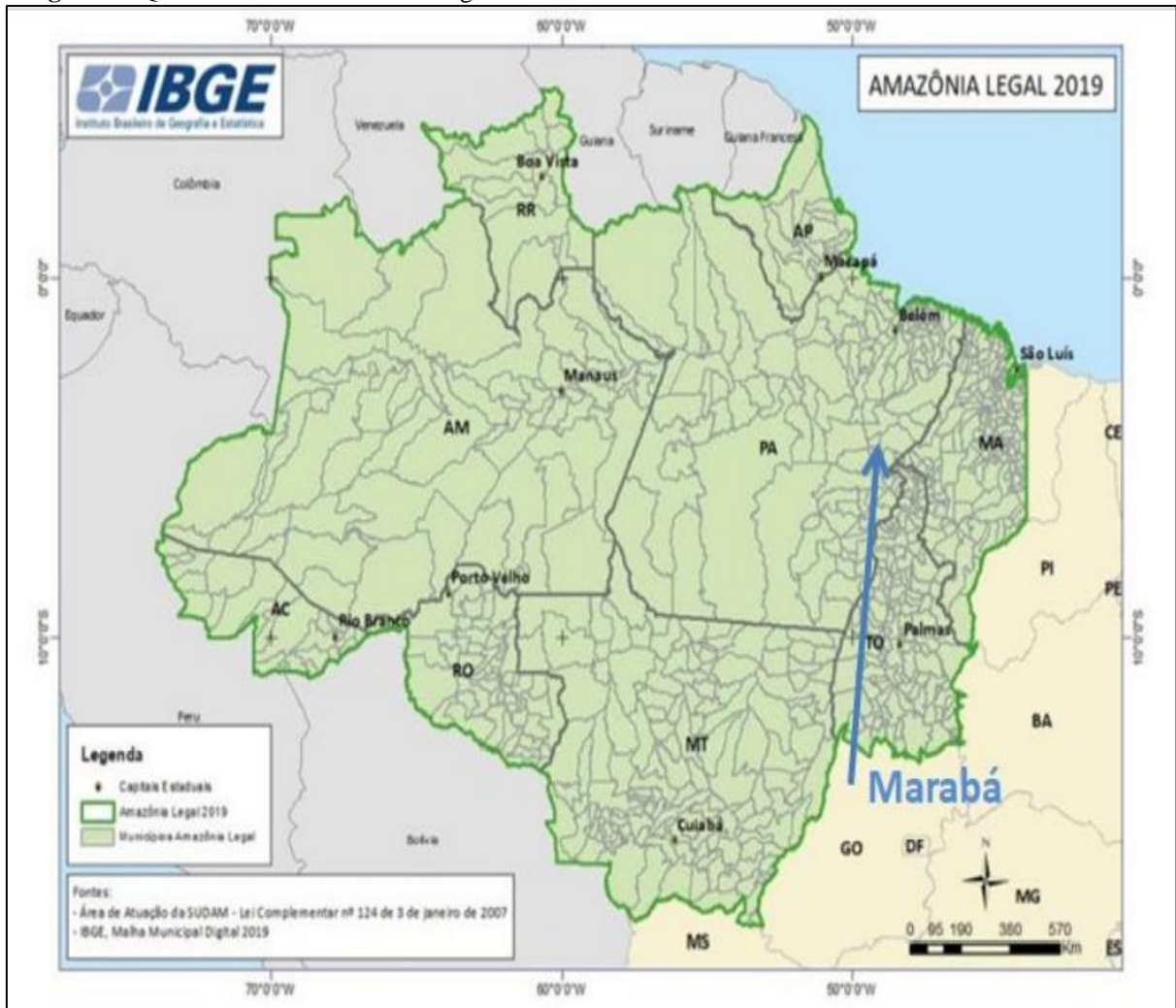
Imagem 1 – Quantitativo de estudantes indígenas 2020.

A Universidade Federal do Sul e Sudeste do Pará – Unifesspa, está localizada no estado do Pará fazendo parte da Amazônia legal, no Sudeste do estado, a cidade de é uma área interligação Econômica entre o Sul e o Norte do estado e também porque pode ser considerada uma cidade que tem uma grande presença de migração.