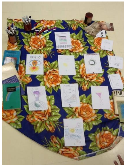
Figura 5: Tarot Poético para Vinicius de Moraes #JogosPoéticos

Em todos os jogos, após a leitura e debate sobre o poeta, é estimulado a escrita autoral e outras formas de expressão artística como desenho, colagem, a performance e jogo teatral, mímica, fotografia, etc. Entendendo que todas são também poesia. Para cada jogo proposto, há um passo a passo, uma dinâmica, que leva o jogador a construir pouco a pouco o seu poema individual e coletivo. E exercitado o desapego das criações, a escuta, a síntese na fala e na escrita, a generosidade, o acolhimento, a observância do sensível, o olhar para o mundo. E suas urgências. Em cada passo são utilizados formas de sorteios, trocas e escolhas - com baralhos, dados, perguntas, etc. - para manter a tensão (o acaso) do jogo. Aqui o processo - alegre e criativo - será fundamental para chegar a um final prazeroso para todos. E a partir, o jogo, a poesia e o conhecimento.