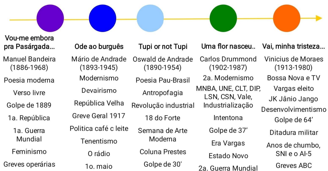
Figura 2: Corpoético de Os modernistas - poetas e seus tempos e cenários históricos.

Esse corpo construído com os poetas também se constitui como período histórico, ou linha do tempo (Fig. 2) não linear, para a contextualização de cada um desses poetas e do conjunto. O poeta como ser histórico, social e político. Sua vida, os cenários em que viveu ou vive, suas escolhas, suas aflições e angustias, suas urgências. Esses esquemas não são didaticamente apresentados aos participantes. Podem ser, porém, antes, são experienciados através dos poemas, da obra do artista. O debate se faz a partir dessa sensibilização, emoção, identificação (ou não), dessa contaminação. Antes, são uma construção para o mestre do jogo ou mediador, que nos Jogos Poéticos é chamado de provocador.