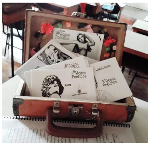
Figura 3: fanzines (livretos) da oficina de Jogos Poéticos

Os Jogos Poéticos - para ler / brincar / criar - precisam de: jogadores, com desejo de jogar, fanzines (ou livretos) pré-construídos com seleção de poemas dos poetas pesquisados (Fig. 3), livros de poesia são bem-vindos, papel lápis caneta para todos os participantes, baralhos dados peças de jogos tradicionais ajudam, um lugar, materiais e recursos disponíveis - incluindo os subjetivos, e, principalmente para os mestres do jogo, mediadores e provocadores, será preciso: pensamento crítico e querer saber da história, gostar de ler, gostar de ler poesia, gostar de gente, de brincar, de criar, de ouvir, de tecer diferentes fios.