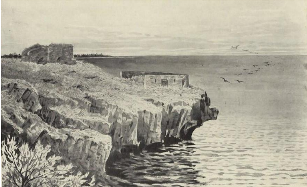
Fig. 1 – “A bit of the old fort, Mombasa” (TUCKER, 1908, vol. 1, p. 16).