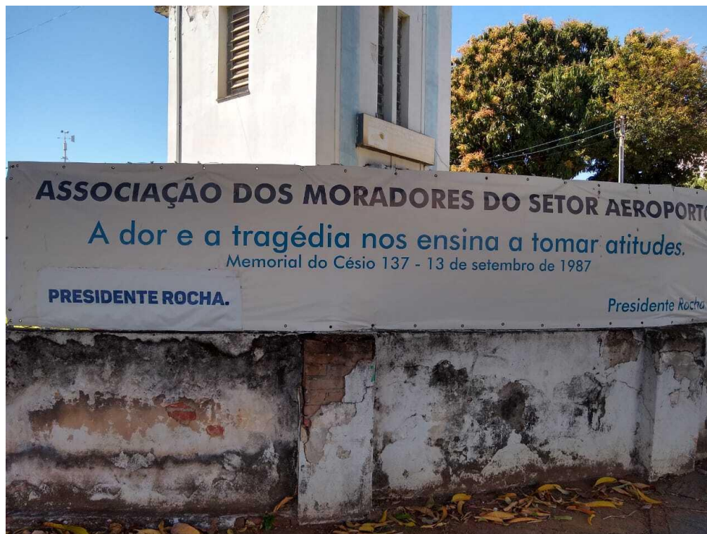
FOTOGRAFIA 3: DEMANDAS DA POPULAÇÃO PELA MEMÓRIA

Independentemente da postura do Governo do Estado de Goiás, a população das regiões afetadas tem se movimentado para rememorar o desastre radiológico Césio-137 e homenagear as vítimas. A Associação dos Moradores do setor Aeroporto espalhou faixas pela região Central de Goiânia conclamando a sociedade civil goianiense para participar da reivindicação por ações mais efetivas em prol do não esquecimento do desastre e propor parcerias com o poder público para a construção de um memorial do Césio-137.