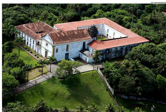
Figura 1: Vista Aérea do Seminário de Olinda e Igreja de Nossa Senhora da Graça. Fonte: Antônio Melcop/Pref.Olinda , 15 de maio de 2009.