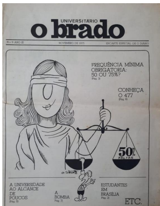
Capa da edição nº 9, novembro de 1975

de equilibrar a balança, o aluno fica numa posição de “quase cair” fora do prato, ou seja, quase reprovado.