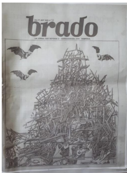
Capa da edição número 11, abril de 1976

A edição número 12 do Brado , de maio de 1976, foi a última a circular porque o Diretório Acadêmico Nelson Hungria, que produzia o jornal, foi extinto, assim como os outros herdados das antigas faculdades, após a aprovação da reforma interna que adaptou a estrutura da UEM ao novo estatuto. A edição se posiciona em relação às mudanças, demonstrando que a reforma, que em maio de 1976 estava em vias de ser aprovada, não era a almejada pelos estudantes representados pelo DANH. E mais tarde ficou claro que as mudanças, de fato, não contemplariam as demandas estudantis, uma vez que não abriram espaço para uma maior participação acadêmica nas decisões da universidade por meio dos órgãos deliberativos e também não solucionaram a maioria dos problemas que a instituição enfrentava.