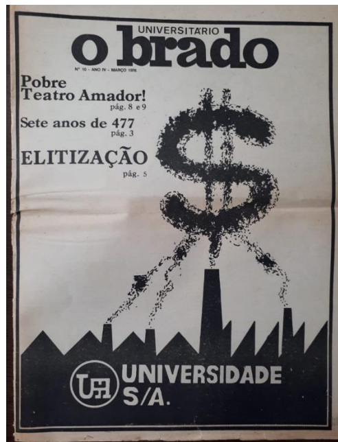
Capa da edição nº 10, março de 1976

No quarto capítulo analisamos as duas últimas edições compiladas para a pesquisa, as de número 11 e 12, nas quais o jornal travou embates diretos com dirigentes da universidade e criticou as medidas da reforma interna que não só iriam interferir na vida acadêmica dos estudantes, como também manteriam o silenciamento e o cerceamento das ações políticas do movimento estudantil.