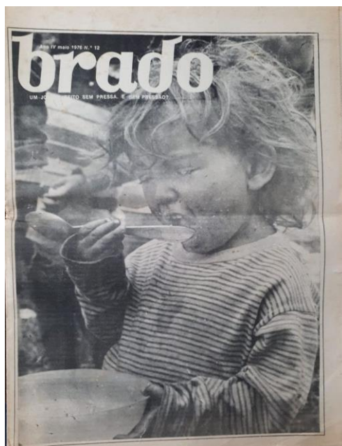
Capa da edição nº 12, maio de 1976

A análise do jornal estudantil O Brado Universitário , produzido pelo Diretório Acadêmico Nelson Hungria, do curso de Direito da UEM, foi, portanto, um importante agente político de resistência à ditadura militar em Maringá. Pelo teor crítico e de denúncia e por defender bandeiras históricas do movimento estudantil que confrontavam a ideologia dos militares, o jornal pode ser caracterizado como uma ação de microrresistência dos estudantes num momento em que a ação política precisava ser estrategicamente calculada porque as manifestações de oposição e protesto eram silenciadas pela legislação autoritária e pela repressão violenta.