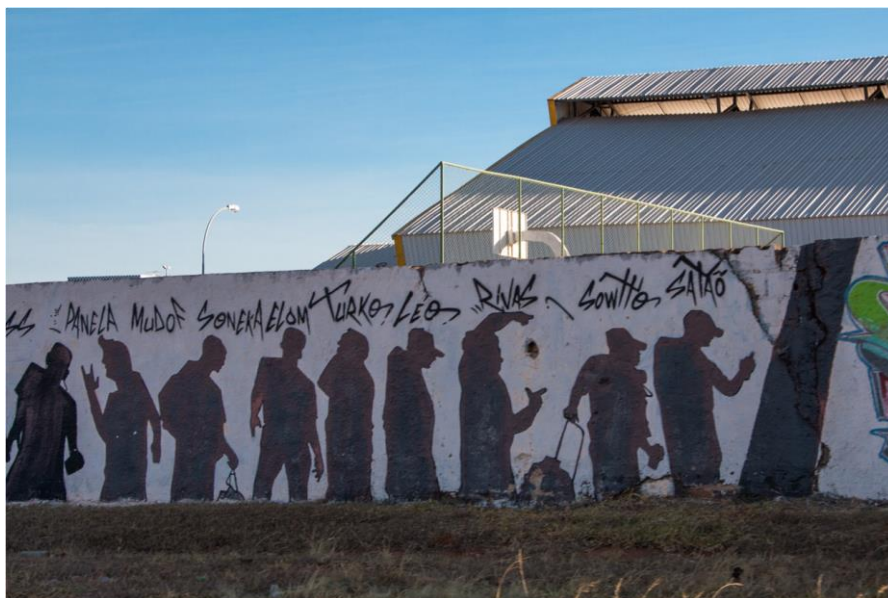
Figura 4: Muro de escola em Ceilândia representando grafiteiros e integrantes de grupos de hip hop . Foto de Juliana Torres, 2017.

nas cidades do entorno, mas também trazem ao Plano Piloto as narrativas destacadas pelo movimento Hip Hop na ocupação dos espaços públicos, conforme podemos observar nas figuras 4 e 5.