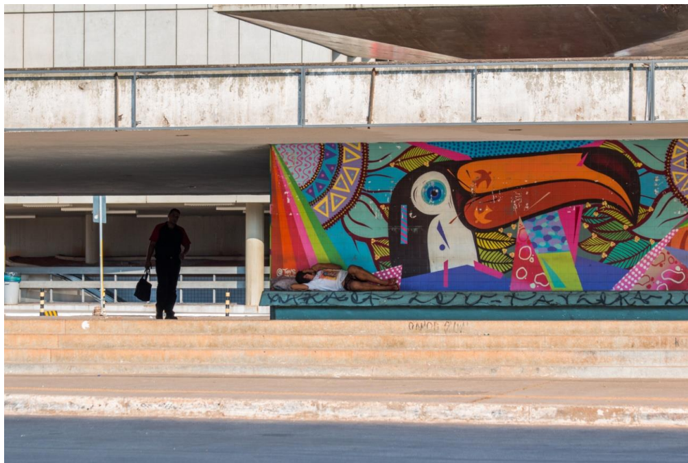
Figura 6: Grafite no centro de Brasília, próximo à rodoviária do Plano Piloto. Foto de Juliana Torres, 2017.

A figura 6 apresenta um grafite localizado bem no centro do Plano Piloto, no cruzamento entre os Eixos Monumental e Residencial, em um local de intensa circulação de pessoas durante o dia. Trata-se do trabalho de um artista da cidade que tem ganhado cada vez mais projeção nacional e internacional, participando de eventos e exposições fora de Brasília e também no exterior. Toys (nome com o qual assina seus grafites na rua) tem seus trabalhos marcados pelo uso de cores quentes, numa combinação cromática e geométrica que deixa evidente a forte influência do artista pernambucano Romero Brito em sua produção. Nessa imagem é representado um tucano, ave típica das florestas tropicais em meio a uma profusão de cores e formas. Destaca-se que no bico do animal desenhado, há uma outra representação de ave muito conhecida pelos habitantes de Brasília. Trata-se da ave desenhada pelo artista plástico Athos Bulcão para os azulejos de um dos cartões postais de Brasília, a Igrejinha Nossa Senhora de Fátima, representando a imagem do Espírito Santo.