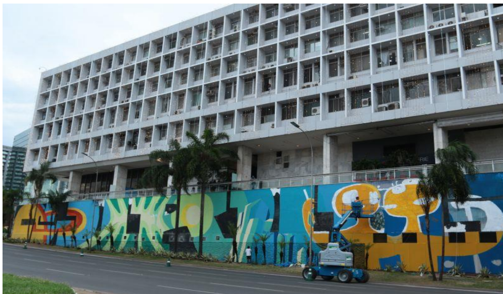
Figura 9: Painel encomendado por shopping a um artista grafiteiro.

No entanto, a história oficial de Brasília, com referência a seus principais monumentos e idealizadores também aparece em alguns grafites encontrados pelas ruas da cidade. Porém, observa-se que esta temática geralmente é pintada a partir de um briefing dado pelo dono do espaço que solicitou o grafite, visando fazer uma homenagem à cidade. Um exemplo disso é um grande painel encomendado por um shopping localizado no centro da cidade a um grafiteiro local, conforme apresentado na figura 9.