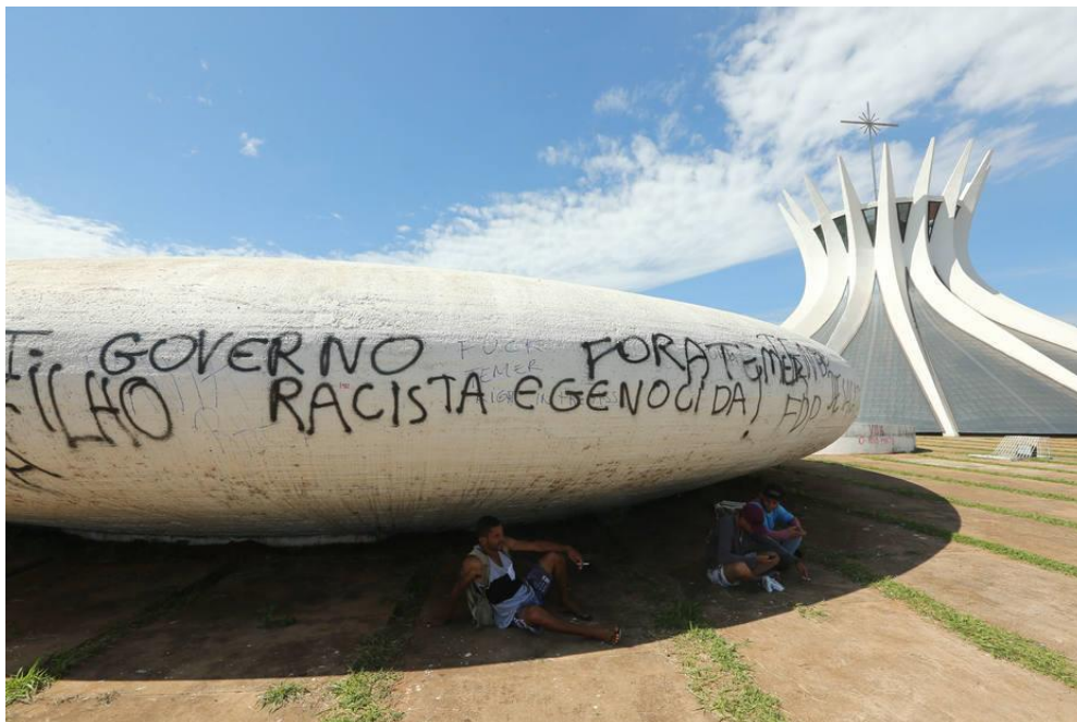
Figura 7: Dizeres contra o atual governo brasileiro localizados na parede externa do batistério da Catedral de Brasília.