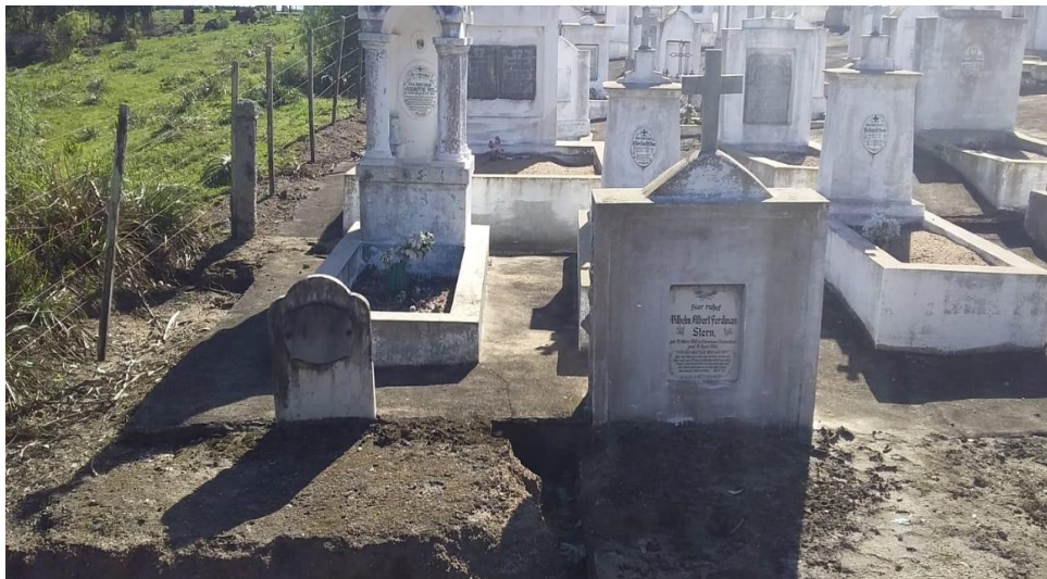
Imagem 1: Sepulturas de Fhlor e Stern. Foto do autor 22/09/2020

No epitáfio do túmulo de Stern há o seguinte texto bíblico: “Não se enganem: ninguém zomba de Deus. O que a pessoa plantar, é isso mesmo que colherá. Se plantar no terreno da sua natureza humana, desse terreno colherá a morte. Porém, se plantar no terreno do Espírito de Deus, desse terreno colherá a vida eterna” (Gálatas 6.7-8) 9 . Também acima do versículo consta a seguinte inscrição lapidar: “Hier Ruht” (aqui descansa) e não, como na maioria das sepulturas, “Hier Ruht in Gott” (aqui descansa em Deus). Tanto o versículo, como a alusão ao descanso (destino eterno), transmite uma clara alusão ao juízo de Deus sobre o falecido e como reforço doutrinário do que não fazer, ou seja, ter “opinião diferente do pastor” .