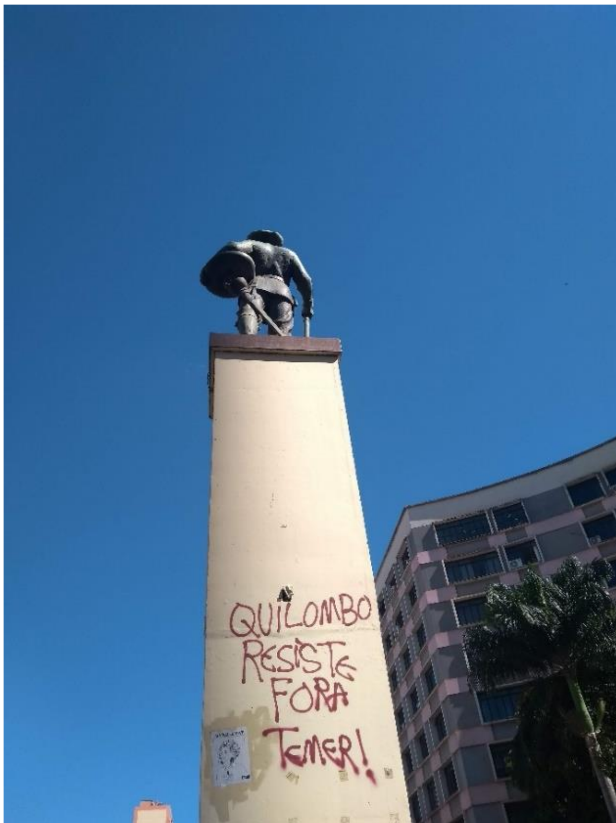
Monumento ao Bandeirante, Goiânia.