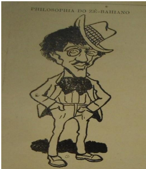
IMAGEM 1: “Filosofia do Zé Baiano”

Autor: não identificado - Fonte: Revista do Brasil , Salvador, 20 ago. 1909. BPEB. Setor: Periódicos Raros. Acervo: Revistas.