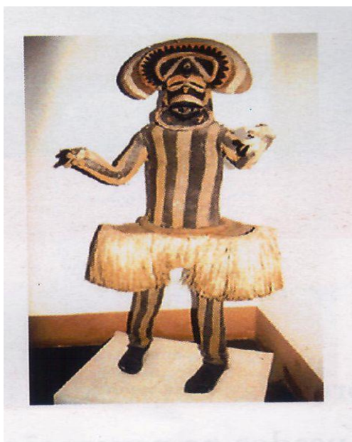
Imagem 5 - Civuvu.