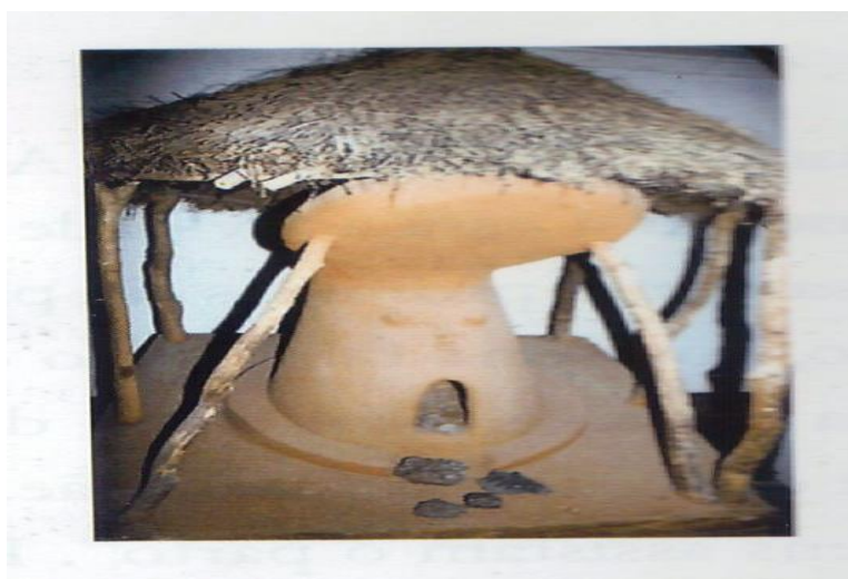
Imagem 3 - Lutengo (Forno).

Nome do Objecto? Etemo (Enxada). Proveniência do objecto e função do objeto? Ovimbundu, Etemo de cabo duplo é utilizado para facilitar as mulheres a trabalharem com os seus bebês nas costas e demonstra um tipo de trabalho: sachar ou capinar em volta das plantações. Próprio de uma agricultura de subsistência. Este tipo de enxada também usado entre os Bakongo 2 .